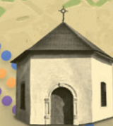
Kaplnka sv. Rozálie

Benediktínsky kláštor (archeologická lokalita)