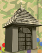
Kaplnka sv. Fr. Xaverského