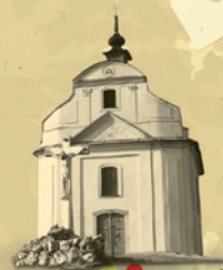
Kaplnka sv. Kríža