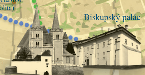
Katedrála sv. Martina